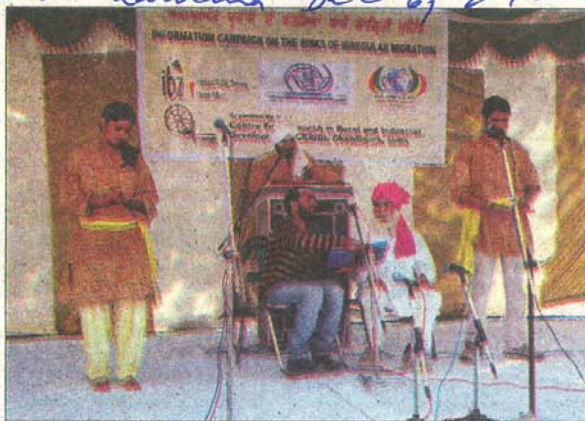
ਕਾਨੂੰਨੀ ਤੇ ਸੁਰੱਖਿਅਤ ਪ੍ਰਵਾਸ ਸੰਬੰਧੀ ਸੈਮੀਨਾਰ ਉਪਰੰਤ ਖੰਡੇ ਗਏ ਨਾਟਕ 'ਠੱਗੀ-ਠੱਗੀ-ਠੱਗੀ' ਦੀ ਇੱਕ ਝਲਕ।