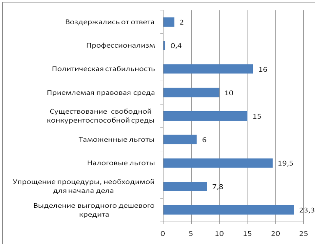
Диаграмма 5. Распределение ответов возвращенных мигрантов по условиям осуществления собственного бизнеса в Грузии (%)

В деле реинтеграции мигрантов огромное значение имеет эффективное направление накопленных ими за границей средств для повышения экономической активности их и других вернувшихся. На вопрос о том, что достаточно для того, чтобы ремигрированный осуществил здесь собственный бизнес, ответы распределились следующим образом (см. диаграмма 5)