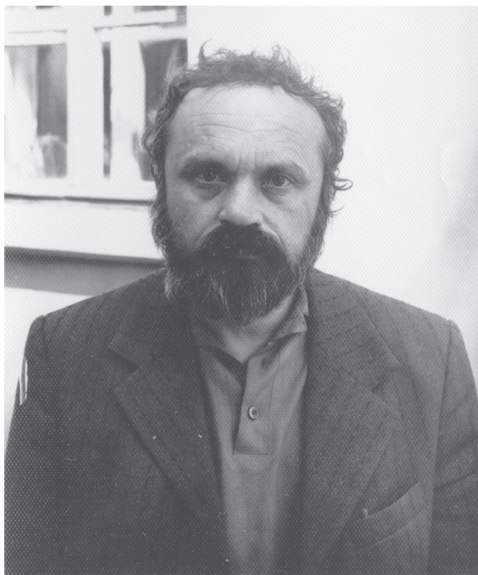
Кім Хадзееў.