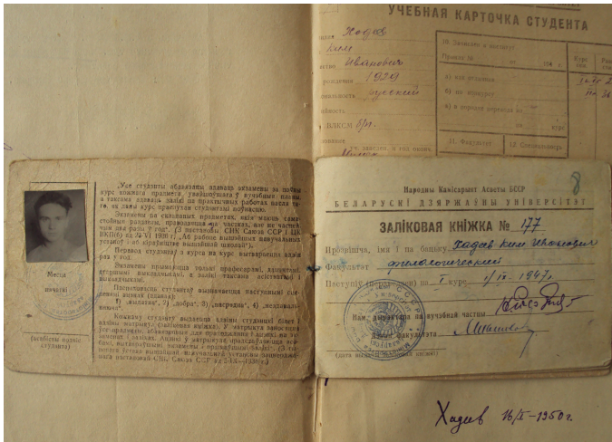
2. Заліковая кніжка Кіма Хадзеева.